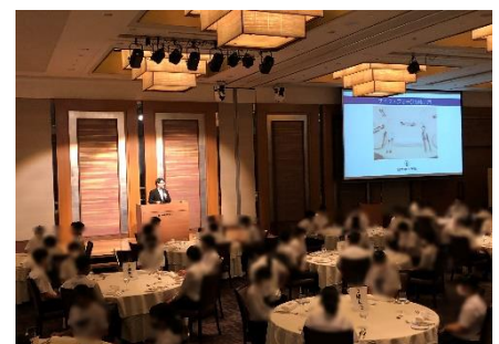
▲ボールルーム日本平でのテーブルマナー風景